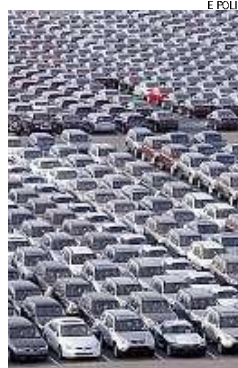
Auto in attesa della vendita

Nel dettaglio, Le importazioni si sono attestate a 2.214 milioni di euro, con una riduzione dell'11,3 per cento rispetto ad una contrazione dell'8,9 per cento della Lombardia e all'aumento del 4,4 per cento dell'Italia Le esportazioni, invece, hanno registrato un incremento del 4,3 per cento rispetto al primo trimestre del 2007, attestandosi a 3.525 milioni di euro. Nello stesso periodo, le esportazioni lombarde sono cresciute del 4,9 per cento e quelle italiane del